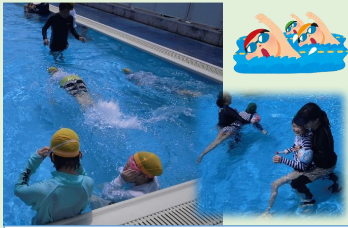
中学部でもプール水泳が始まっています。個々の実態・課題に応じた学習が行われています。(R3.6.25)