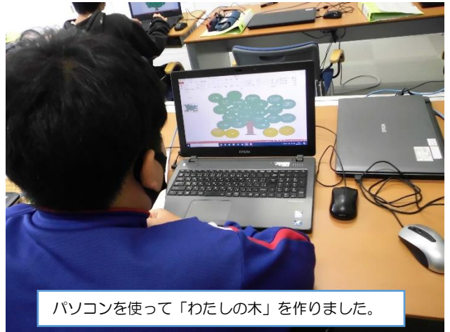
パソコンを使って「わたしの木」を作りました。