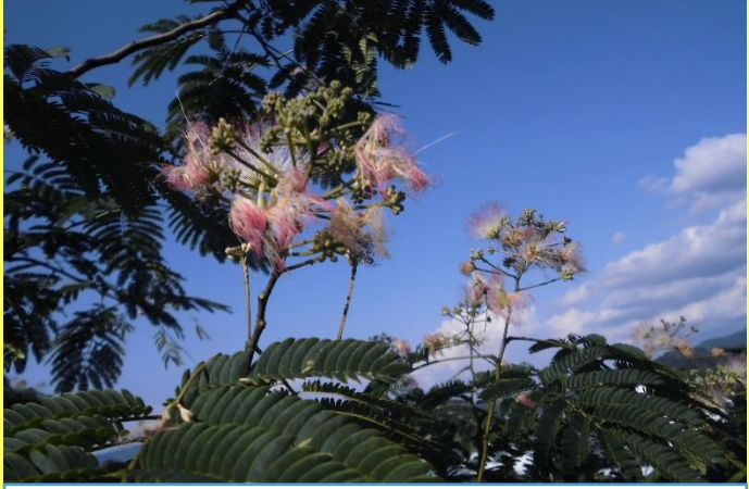
運動場のフェンス近くでネムノキの花が咲き出しました。暑い日が続いていますが、花は涼しそうに感じます。(R3.6.23)