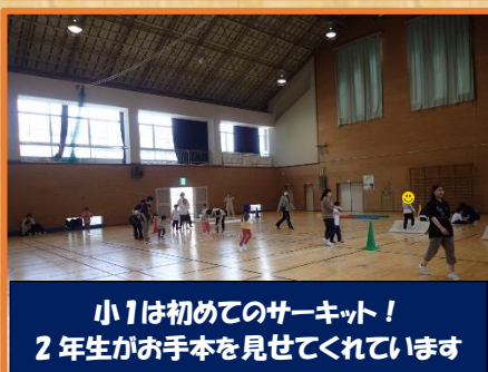
小1は初めてのサーキット！ 2年生がお手本を見せてくれています