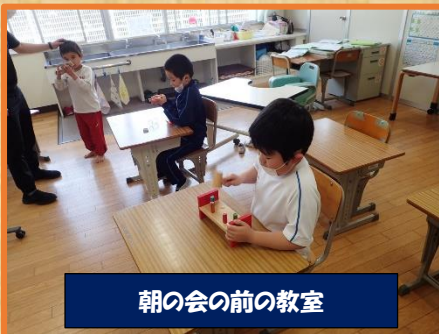
朝の会の前の教室