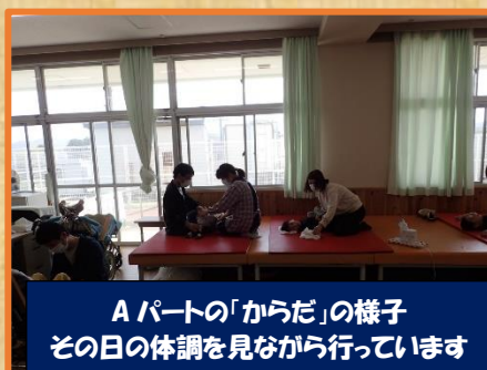
Aパートの「からだ」の様子 その日の体調を見ながら行っています