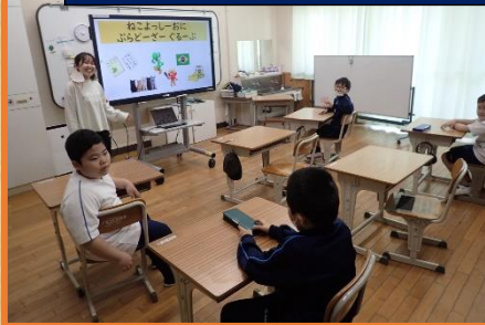
小学部のグループ学習での様子です。グループ名も子どもたちが分かりやすいように工夫されています。

4/15（月）から、どの学部も通常の授業が始まり、グループ教科学習など様々な授業で担当の先生も変わり新たなメンバーで今年度をスタートしています。春のこの時期は夏野菜の栽培に取り組んでいるところが多く、今年は何を植えるのか聞いたり、今年は何んとか大きく育てて欲しいという願いも込めたりしている様子が見られました。まずは、畑の整備からで、天気の良い日に協力して植える準備をしていました。