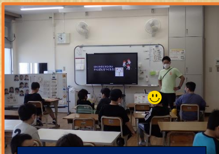
小学部：畑の準備の勉強