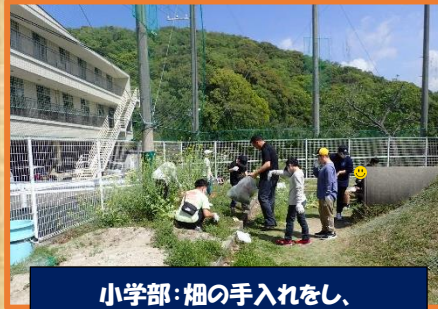
小学部：畑の手入れをし、 夏野菜を植えます