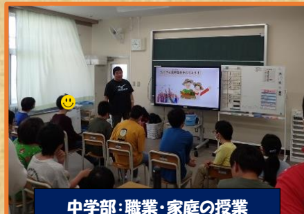
中学部：職業・家庭の授業 夏野菜を植えます