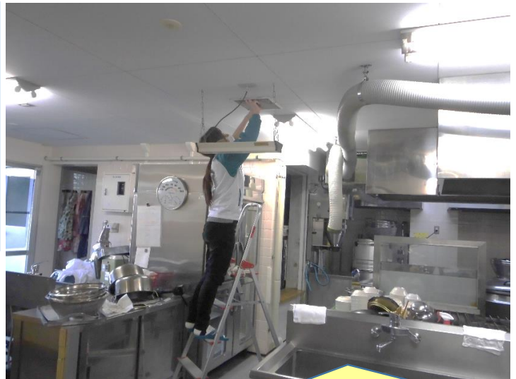
厨房の換気口の清掃もしっかりと行い、消毒しています。

これに加えて、栄養教諭の先生は、休校の予定が変わるたびに給食メニューを作り直し、再検討し、アレルギー食対応の児童生徒への対応についても各担任の先生と打ち合わせをしてくれています。メニュー変更や食材の発注や取り消しなど悩みながらも安全・安心な給食の提供に取り組んでくれています。