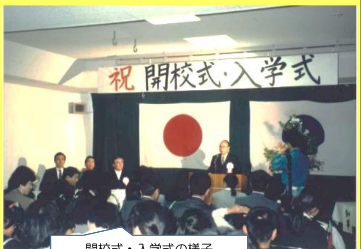
開校式・入学式の様子

平成3年4月12日（金）、たちばな養護学校の開校式・入学式が、今の小学部・多目的ホールで行われました。児童生徒数は、76名（小学部 25名、中学部 17名、高等部 34名）、スクールバス 3台と記録に残っています。今年度の本校の児童生徒数は、173名、スクールバス（マイクロバスを含む）6台です。開校時からイメージできないくらい