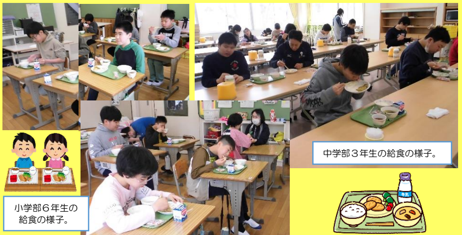
小学部6年生の給食の様子。

ご飯、牛乳、タンドリーチキン(リクエストメニュー)、ポテトサラダ、レタスとコーンのスープ、米粉のいちごケーキ or 米粉のりんごタルト