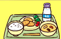
中学部3年生の給食の様子。