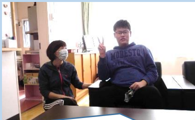
10月27日(火)、昼休みに校長室へ報告に来てくれた時の様子。

出発前日、参加生徒の一人が校長室を訪れ、修学旅行の行き先や楽しみにしていることなどを報告に来てくれました。